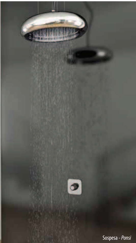
Sospesa - Ponsi