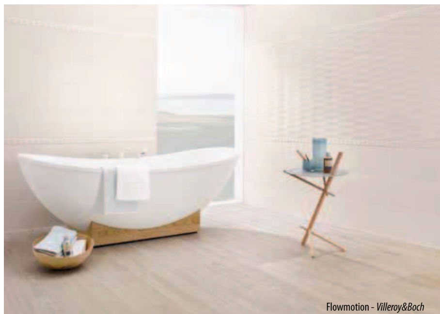
Flowmotion - Villeroy&amp;Boch

Si ispirano alla natura anche le creazioni di Villeroy&Boch che presenta una nuova soluzione per pareti che consente di creare negli ambienti un'atmosfera classico-moderna o naturale. Con ' Natural Harmony ' le piastrelle di base e le bordure a rilievo coordinate possono essere accostate in un armonioso gioco tono su tono. L'azienda tedesca leader europeo nella pro-