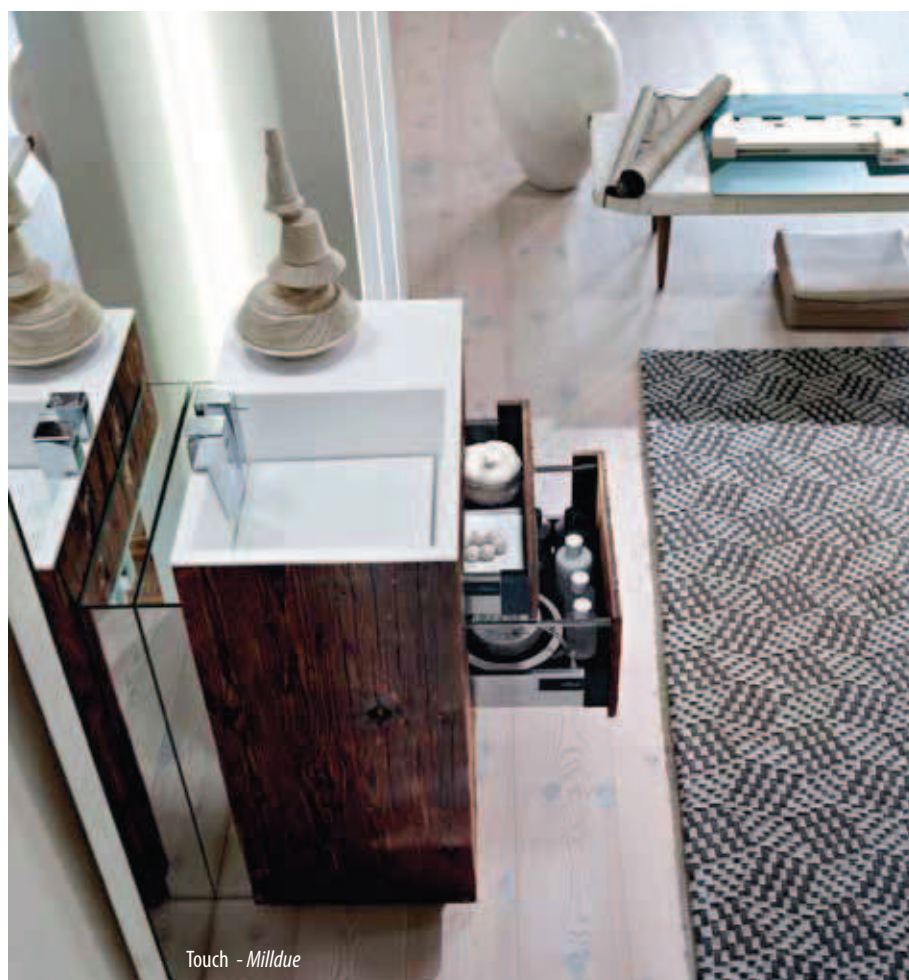
Touch - Milldue

tenuto tecnologico sono le caratteristiche delle proposte firmate Milldue che mettono al centro l'emozionalità della stanza da bagno e l'autenticità dei materiali selezionati. Nella collezione 'Touch' i grandi protagonisti sono i legni restaurati e naturali , le eco-malte e i laccati che sintetizzano l'essenzialità delle linee esaltando il minimal, senza trascurare la funzionalità. L'aspetto monomaterico, la modularità e la riciclabilità dei materiali utilizzati, rendono questi prodotti un ottimo esempio di progettazione ecosostenibile .