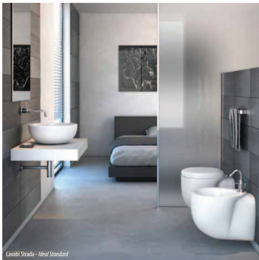
Lavabi Strada - Ideal Standard

Materiali naturali, cura artigianale e alto con-