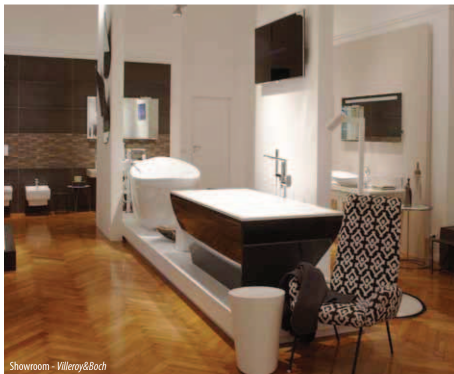
Showroom - Villeroy&amp;Boch

' Ecopower ' è la risposta alla domanda crescente di prodotti 'intelligenti', progettati per rispondere con efficacia alle esigenze di risparmio idrico