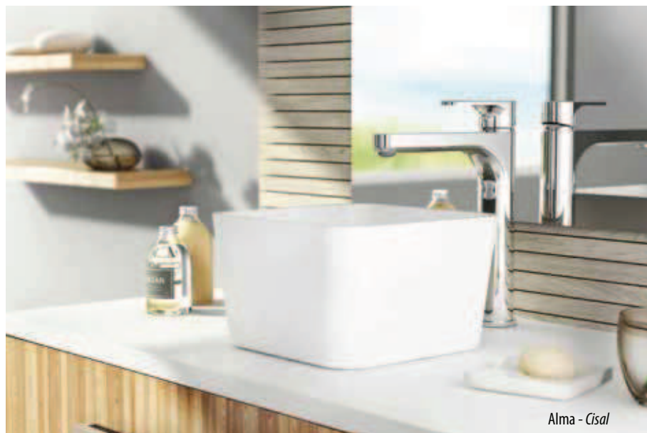
Alma - Cisal

Risparmio, sicurezza e funzionalità anche per 'Alma', la nuova collezione firmata Cisal . Un risultato estetico che si traduce in un equilibrio formale tra volumi arrotondati e superfici piane, un gioco di proporzioni dal segno distintivo per una proposta che si colloca in modo strategico sul mercato abbinando anche il concetto di risparmio e sicurezza. Tutti i lavabi possono essere dotati del sistema ' Energysave ', che permette l'apertura dell'erogazione dell'acqua con leva centrale a temperatura fredda evitando l'accensione involontaria della caldaia.