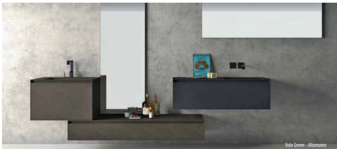
Volo Green - Altamarea